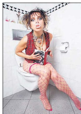
Gocha! Reading a book.