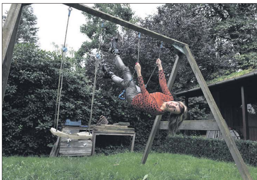
De tuin dient vaak als decor voor de foto's van Lilith.

Lilith is van 29/09 tot en met 02/10 aan het werk in Museum van Bommel van Dam in Venlo.