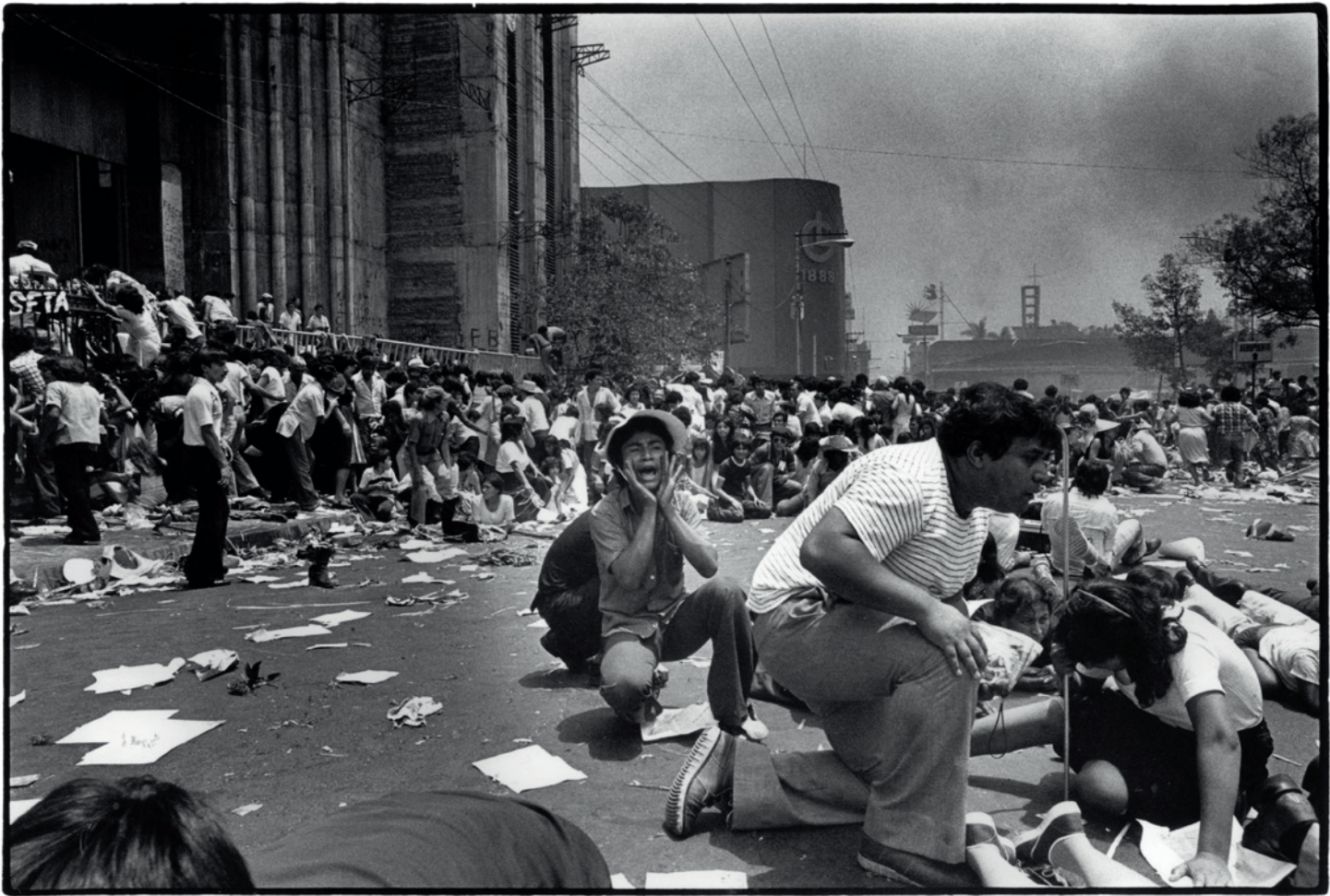
El Salvador, 30-03-1980. Begrafenis van de vermoorde aartsbisschop Romero. De menigte wordt beschoten.