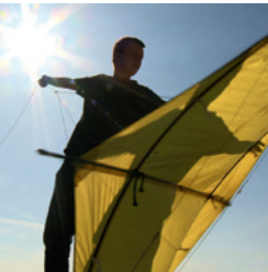
Still uit 010-Foto Rotterdam, een film van Marc Schmidt.

www.gercoderuijter.com www.polakvanbekkum.com