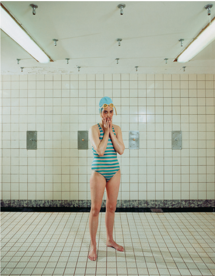
■ Zelfportret, Marnixbad, 1991.

We vroegen negen fotografen en één fotografinduo een beeld of oeuvre te noemen dat hen geïnspireerd of geraakt heeft, of dat ze gewoon mooi vinden. Tien keuzes met een korte uitleg waarom.