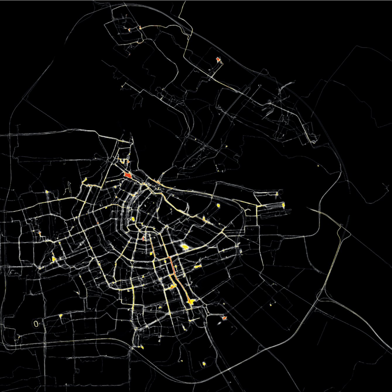
AmsterdamREALTIME.