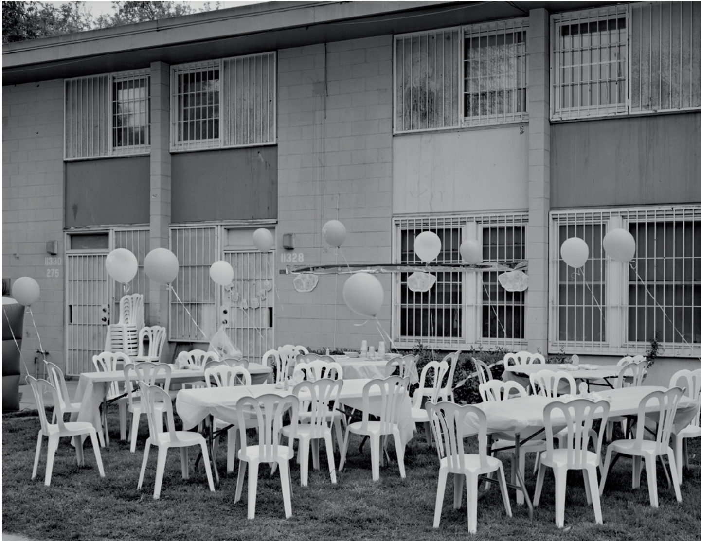
Tish's Baby Shower, 2008.