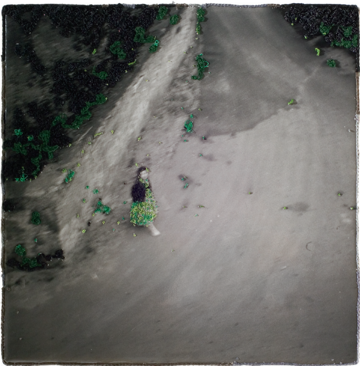
■ Stiff City, 2005. Bestikte foto, 29,7 x 29,7 cm. Particuliere collectie, New York. © Berend Strik