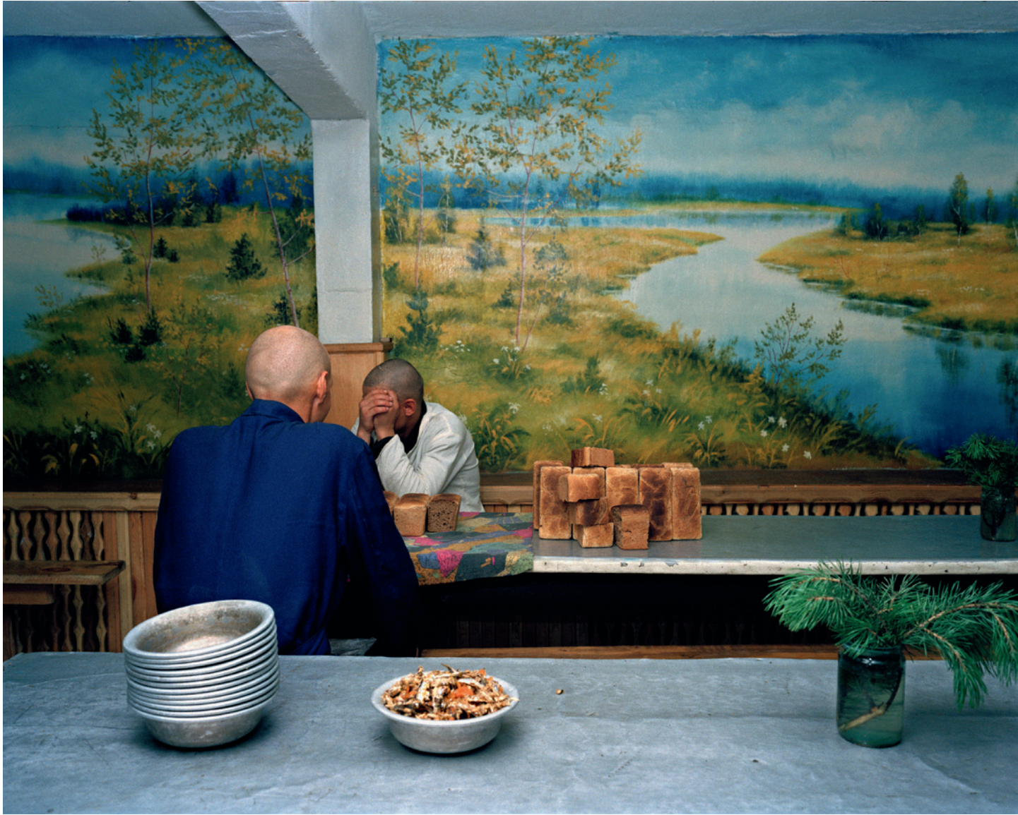
Krasnoyarsk, Russia, 2000, Camp 27 (uit de serie 'Zona').