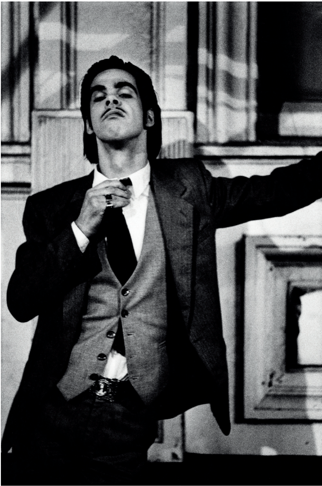
■ Nick Cave.